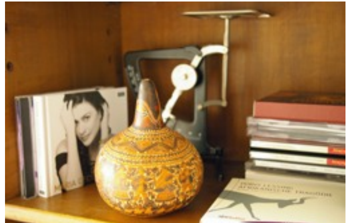
Neuerdings stehen auch Hörbücher im „Bücherregal“

Persönlich bin ich niemand, der gezielt nach Kontakt sucht, aber wenn man mag, ergibt sich das hier einfach. Ich gehe zum Beispiel an sechs Tagen in der Woche morgens schwimmen, und ein kleiner Plausch mit einer Mitbewohnerin ist fester Bestandteil meines „Sportprogramms“.