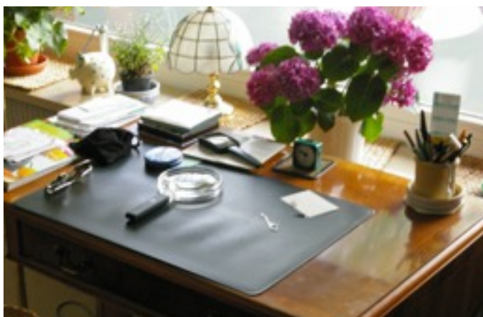
Der Platz an der Sonne: der Sekretär im Appartement ist Lese- und Schreibplatz

Seit dem 28. September 2004 lebe ich mittlerweile in Bendestorf, habe hier schnell Wurzeln geschlagen. Natürlich war es nicht