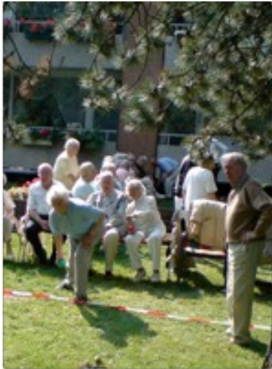
Spaß beim Boule-Spiel

Gerade jetzt im Frühling, wenn die Sonne lockt, findet man Entspannung in der weitläufigen Gartenanlage mit dem Springbrunnen und den Bänken und Liegen. Gerade jetzt beginnt auch wieder die Zeit des Boule-Spiels.