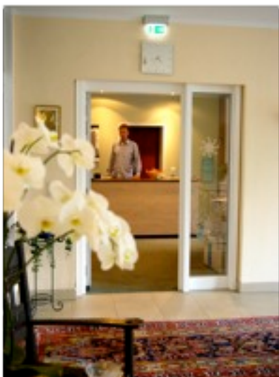
Rezeption und Eingang

Die Rezeption ist 365 Tage im Jahr Anlaufpunkt für alle, die Wünsche und Fragen haben. Die Schuhe müssen zum Besohlen, die Kleidung zum